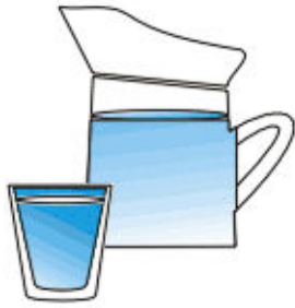
un verre d'eau